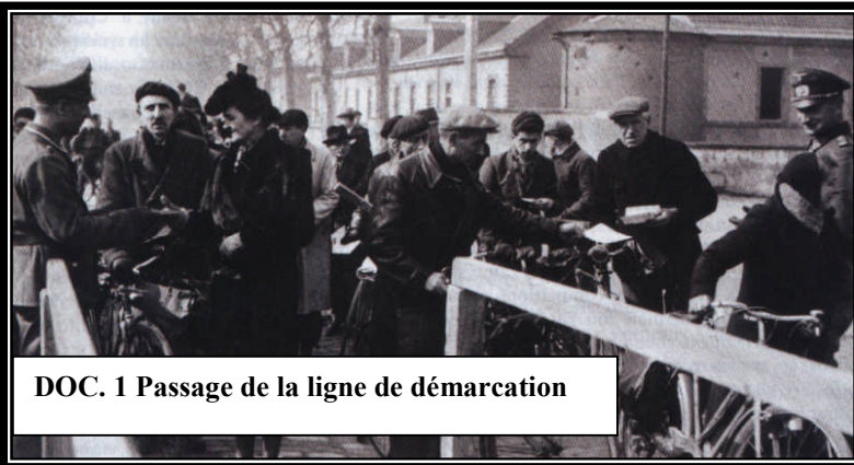
DOC. 1 Passage de la ligne de démarcation

Quelle est la vie quotidienne des Français sous l'occupation ?