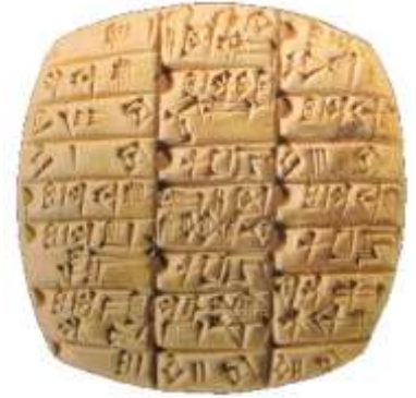
DOC. 2 ..... (..... av. J-C)