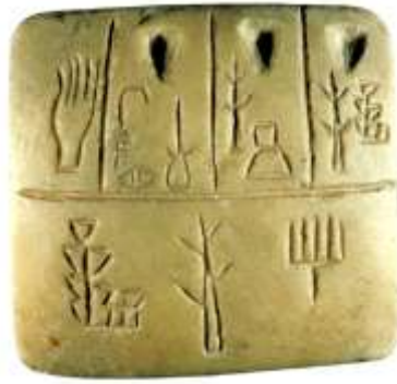
DOC. 1 ..... (..... av. J-C)