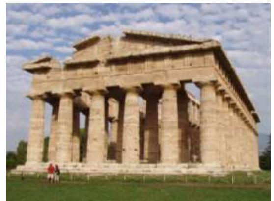
Temple d'Héra, 450 av. J.-C., Paestum (Sud de Naples, Italie).

D'après Justin, Histoire universelle , 2 e siècle ap. J.-C